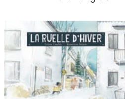
LA RUELLE D'HIVER Céline Comtois