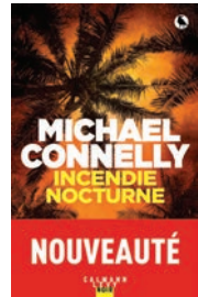
INCENDIE NOCTURNE Michael Connelly