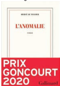
L'ANOMALIE Hervé Le Tellier